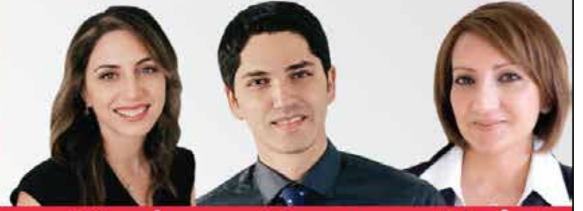
Masi Real Estate Broker